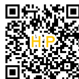
みんなで歌う 第九の会 HP

日時：12月1日（日）／開場14時 開演15時 出演者：みんなで歌う第九の会、仙台フィルハーモニー管弦楽団、 文屋小百合（ソプラノ）、赤間夏海（アルト）、田中豊輝（テノール）、 深瀬廉（バリトン） チケット：全席自由 一般3,500円 指定4,000円（市民会館のみ販売）※未就学児の入場不可。 チケット発売日：9月1日（日） プレイガイド：岩沼市民会館、岡文、Café おやこの木、 チケットぴあ（Pコード：275050）